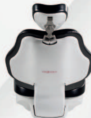
SCHIENALE XL MEMORY FOAM